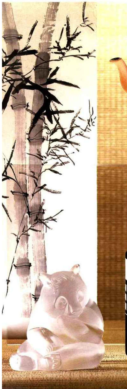
Le panda est un des emblèmes de la Chine. Le porte-photo en cristal satiné de Lalique rend hommage à cette espèce protégée. Prix public conseillé : 250 €.