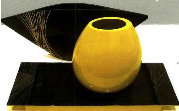
Vases et plateau en laque de Anha : vase "Manta Medium" noir (60 x 9 x 24 cm), vase "Pearl" jaune (17 x 23 x 25 cm) et plateau "Apollo" (56 x 20,5 x 3,5 cm). Prix public conseillé : à partir de 75 € le plateau et 115 € le vase.