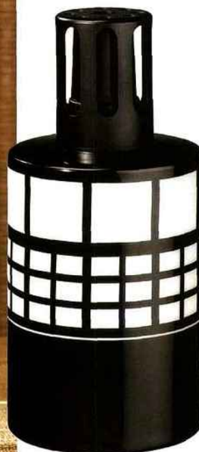
La lampe "Paravent Japonais" de Lampe Berger est réalisée en porcelaine. Sa forme épurée d'inspiration asiatique reprend le motif d'un des meubles classiques de la tradition nipponne. Dans la collection "Esprit Design". Prix public conseillé : 80 €.

Nouveautés produits réalisées par Anne bréchoire.