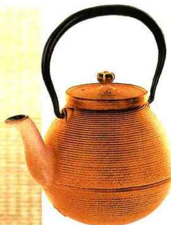
Théières d'inspiration chinoises "Tsumogata" empilables, aux couleurs acidulées, vert, bleu, rose et orange, de Théodor . Prix public conseillé : 95 €, la théière (0,55 L).