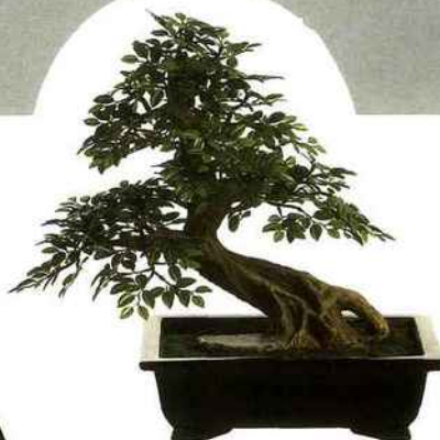
L'art du bonsaï existe depuis le VIII e siècle en Chine. Un art difficile, simplifié par l'arbre "Dome" en pot, haut de 58 cm, de Sia . Réalisé en polyrésine, l'entretien disparaît et le bonsaï devient un jeu d'enfant. Prix public conseillé : 179 €.